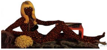
"Sich den Luxus erzüchten", 2002