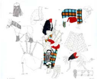
"Sich den Luxus erzüchten", 2004