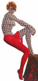
"Sich den Luxus erzüchten", 2007