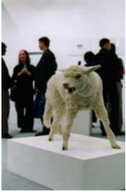
"Der Wolf - als Räuber - ertarnt sich seine begehrte Beute", 2003