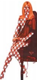
"Sich den Luxus erzüchten", 2007