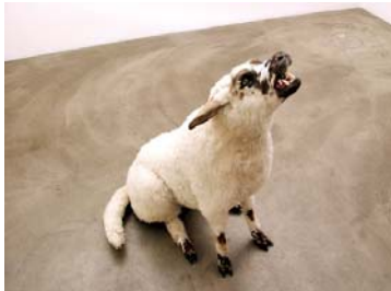
"Der Wolf - als Räuber - ertarnt sich seine begehrte Beute", 2004