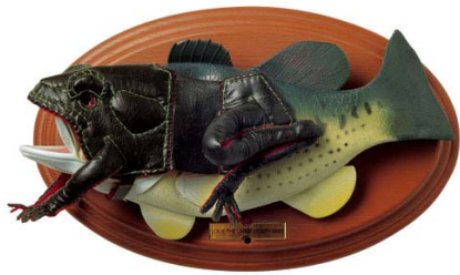
"Der Barsch - als Räuber - ertarnt sich die begehrte Beute", 2001