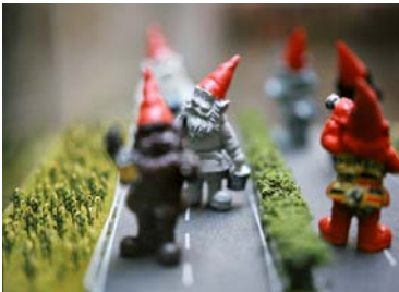
Aus "Markenwelten", 2007