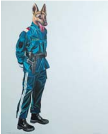
"Der Polizist - zum Schutz - ertarnt sich seinen tierischen Begleiter", 2004