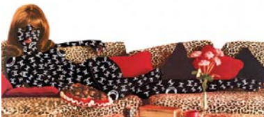
"Sich den Luxus erzüchten", 2002