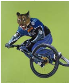
"Der Mountainbiker - zum Schutz - ertarnt sich seinen gefürchteten Verfolger"', 2004