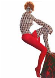
"Sich den Luxus erzüchten", 2007