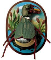
"Die Ente - als Räuber - ertarnt sich die begehrte Beute", 2001