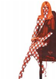
"Sich den Luxus erzüchten", 2007