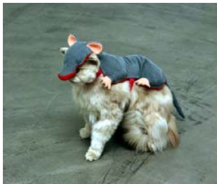
"Die Katze - als Räuber - ertarnt sich ihre begehrte Beute", 2004